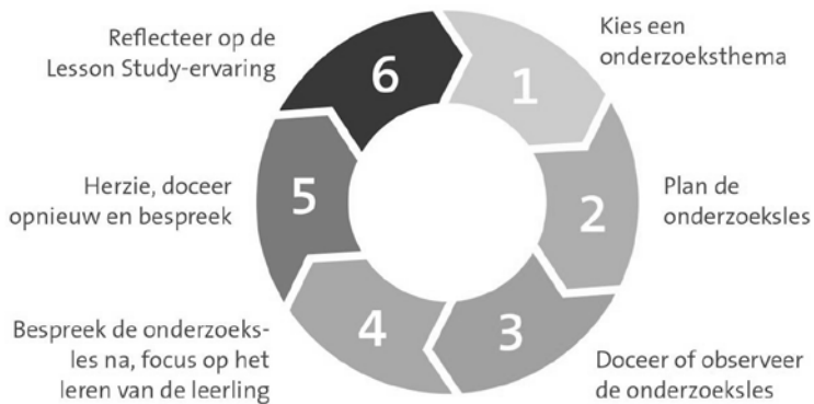
Figuur 1. De Lesson Study -cyclus 13 .

Lesson Study is een van oorsprong Japanse professionaliseringsaanpak die leraren stimuleert te focussen op het leren van leerlingen. In een Lesson Study doorlopen leraren in teamverband een cyclus met verschillende stappen om het leren van een specifiek onderwerp door leerlingen te verbeteren (zie Figuur 1). Leraren analyseren daarbij kritisch en systematisch de leerprestaties van leerlingen, en verbeteren zo hun (vak)didactisch handelen.