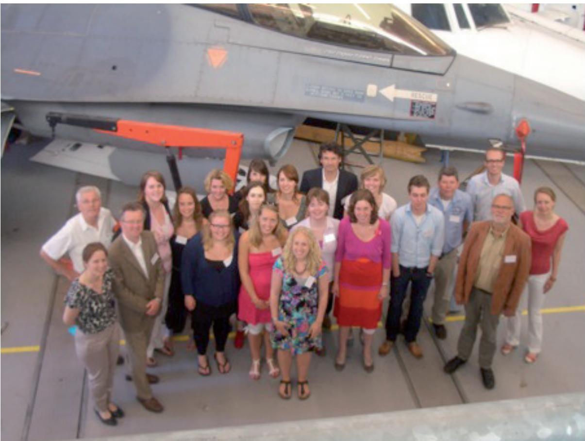
Deelnemers Alumnidag 2012