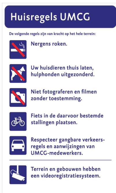
Afbeelding 1: Huisregels UMCG

Als aanvulling op bovengenoemde algemene gedragsregels in en om de gebouwen, wordt door de managing director zorggedragen voor specifieke afspraken met de studentenorganisaties gehuisvest op de Healthy Ageing Campus, vastgelegd in de “Overeenkomst Ruimtegebruik voor Studentenorganisaties”, hierna ‘ruimteovereenkomst’.