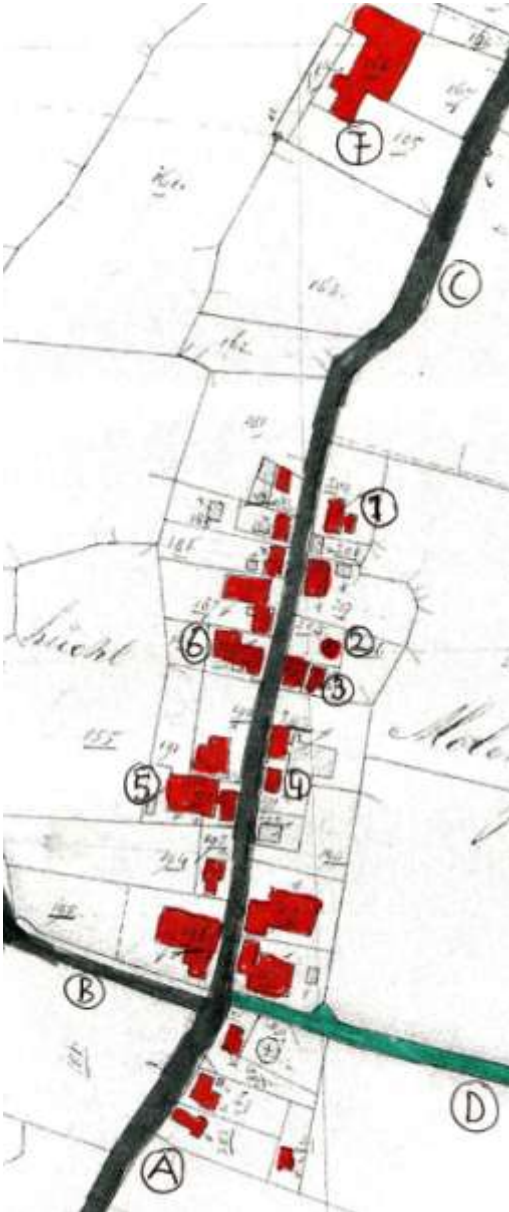
Schetsmatige kaart van de huizen in Molenrij in de 18 e eeuw