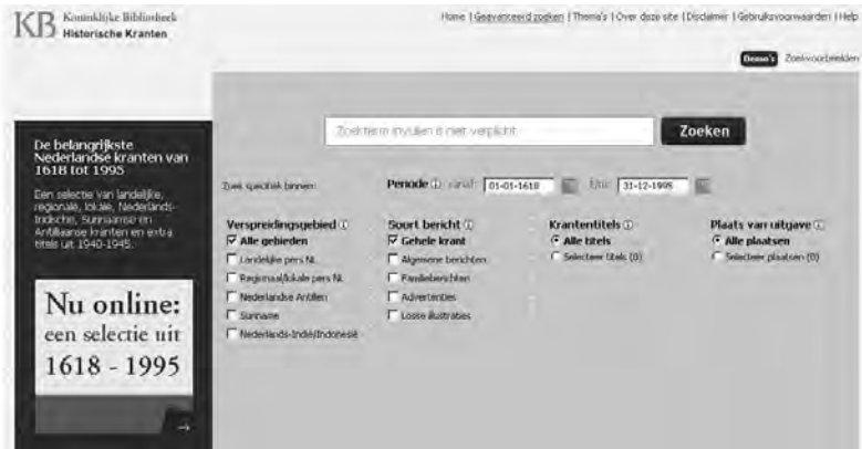
Zoekscherm voor geavanceerd zoeken op de site Historische Kranten van de Koninklijke Bibliotheek.

– in het geval van kranten meestal een individueel artikel, foto of advertentie – worden toegevoegd. Dit is een eerste en nuttige index op artikelen, die in theorie zou leiden tot nauwkeuriger zoekresultaten. In de praktijk worden echter meestal maar zeer beperkt metadata toegevoegd, omdat dit een zeer tijdrovend en dus kostbaar proces is. In het geval van de website De Krant van Toen die Friese en Groningse titels bevat, is het bijvoorbeeld slechts mogelijk om in specifieke titels en tijdspereodes te zoeken. 40 In de krantenbank van de Koninklijke Bibliotheek (KB) en die van de British Library (BL) kan men zoekacties daarnaast beperken tot de plaats van publicatie en het soort artikel (advertenties, familieberichten, losse illustraties en artikelen, waaraan de Britse site nog een categorie ‘miscellaneous’ toevoegt). 41 Bij de KB kan men voorts nog zoeken op verspreidingsgebied (landelijke en regionale/lokale kranten, en de verschillende koloniën), terwijl de BL de handige functie heeft om alleen op de voorpagina te zoeken.