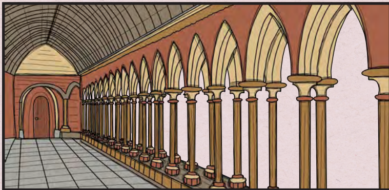
Klooster van Sainte Marie, in Annonay.