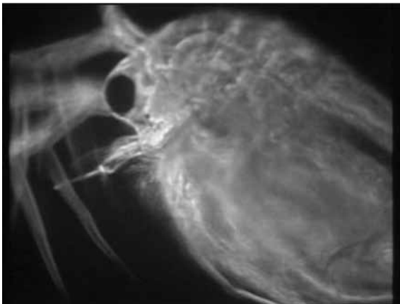
De watervlo in AVONTUREN OP HET LAND.

De wijze waarop Van der Elsen technologie gebruikt om te vergroten is een typisch kenmerk van de natuurfilm: het toont het vermogen om dat wat gewoonlijk moeilijk zichtbaar is, ineens heel dichtbij te halen. Dat doet Van der Elsen vaker in deze film. Voortdurend gaat hij op zoek naar mogelijkheden om de natuur rondom zijn huis zichtbaar te maken. Desnoods reist hij af naar de Technische Universiteit Twente (destijds T.H.-Enschede) om daar zijn in de sloot gevangen watervlooitjes onder de microscoop te laten leggen. Het effect van die opnames is verbluffend mooi. Ultrakleine beestje – voorheen nauwelijks zichtbaar – worden nu omgetoverd tot prachtige vormen. De opnames hebben een bijna abstracte schoonheid. Ze zijn zo in een lange traditie te plaatsen van kijken naar de wondere wereld van de natuur, zoals die door J.C. Mol of Jean Painlevé al werd beoefend. Maar anders dan deze filmmakers doet Van der Elsen geen poging tot wetenschappelijke inbedding van de beelden.