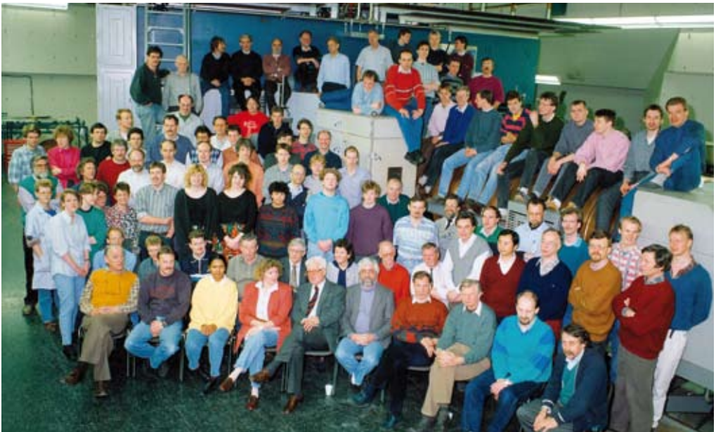
Het voltallige instituutspersoneel in januari 1992 op de foto bij het afscheid van het oude cyclotron