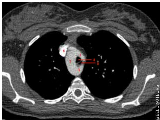
CT-thorax: 1. truncus brachiocephalicus links waaruit de arteria carotis links en de arteria subclavia links ontspringen, 2. rechtszijdige arcus aortae, 3. divertikel van Kommerell, 4. trachea, 5. oesofagus, 6. vena cava superior.

Het antwoord vindt u volgende week in Medisch Contact.