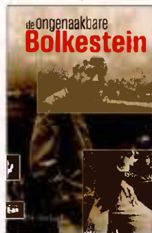
DIK VERKUIL De ongenaakbare Bolkestein Prometheus, 776 blz.

Hoe het toch kan dat zó'n onthande man de tijdgeest zo goed kon lezen, blijft een groot mysterie