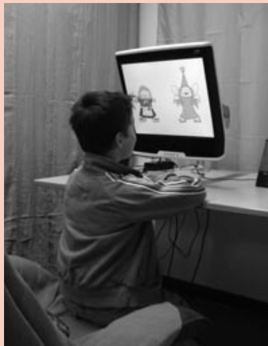
The eye tracker at the Eye Lab