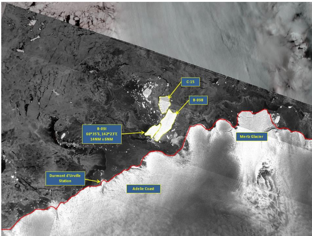
Photo: October 21, 2015 SENTINEL-1 image showing B-091 separating from B-09B.

Information on Southern Hemisphere icebergs are posted to the website every Friday, with size, position, and remarks at http://www.natice.noaa.gov/pub/icebergs/Iceberg_Tabular.pdf