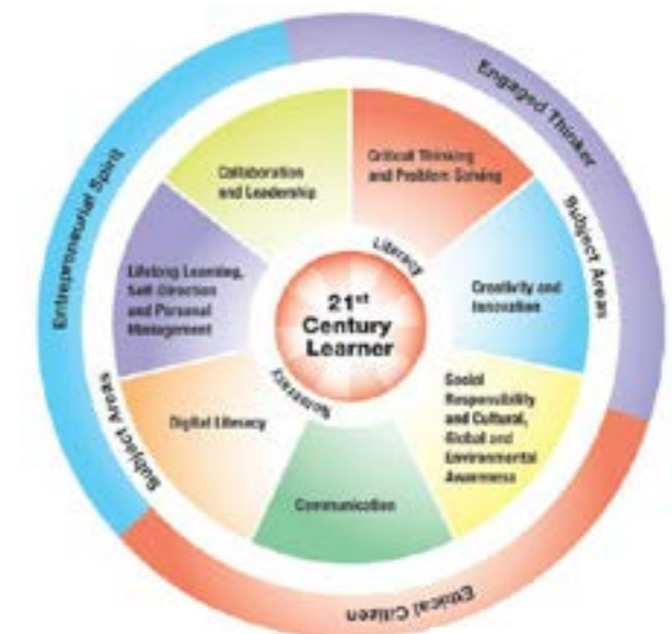
21st Century Skills