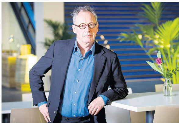
Hans Wansink: „Partijen verdwijnen niet helemaal maar hebben veel minder een bindende functie.”

Er tekent zich volgens hem een nieuwe klassentegenstelling af tussen een hoogopgeleide, welvarende, kosmopolitische bovenlaag en de rest van de bevolking, die volledig in beslag wordt genomen door de strijd om het bestaan.