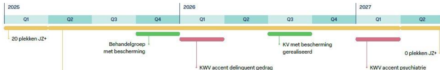
Planning ombouw JeugdzorgPlus

De afbouw van de huidige JeugdzorgPlus is afhankelijk van verschillende factoren, waaronder de succesvolle opbouw van passende alternatieve plekken en het waarborgen van veiligheid en kwaliteit op de JeugdzorgPlus Hoogeweg. Hierdoor is het tempo en de omvang van de afbouw niet op voorhand exact vast te stellen.