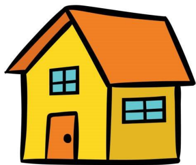
Kleinschalige voorziening met bescherming