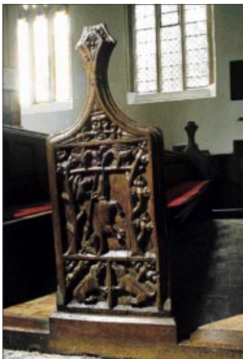
Een prachtig bewerkte bank in Brent Knoll (Somerset) in Groot-Brittannië, gebaseerd op de wereldse fabel Reinaert de vos .

In de Scandinavische landen zijn veel kerken wel vrij toegankelijk, evenals in Engeland. "Maar helaas verandert het daar langzamerhand ook, vanwege de angst voor diefstal." Ze troffen stofzuigende dominees aan, haalden boeren van hun tractor om een sleutel te bemachtigen, moesten praten als Brugman om kosters aan hun kant te krijgen, ze haalden soms halve interieurs leeg om goede foto's te kunnen maken. "Dan stonden er honderd plastic stoelen opgeslagen voor het sacramentshuis dat wij wilden fotograferen." Middeleeuwse dorpskerken zijn volgens de twee wetenschappers vooral zo interessant, omdat in die tijd de godsdienst nog overal gelijk was. "Er was nog geen reformatie, heel Europa was katholiek. Als een Portugees in die tijd naar Groningen was gekomen, had hij blindelings de weg kunnen vinden in de kerk. Het interieur was overal ongeveer hetzelfde, bevatte dezelfde elementen, dezelfde heiligen." Hoewel dat laatste ook weer niet altijd het geval was. "Je treft soms heiligen aan, die nergens anders bestaan", vertelt Kroesen. "Tja, Rome kon niet dat hele uitgestrekte