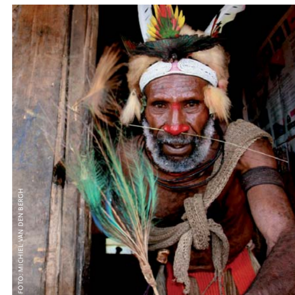
Lid van de Tikibi-clan met veren van de Blauwe Paradijsvogel.

Meer informatie: www.rug.nl/frw/onderwijs/scriptieprijs/index