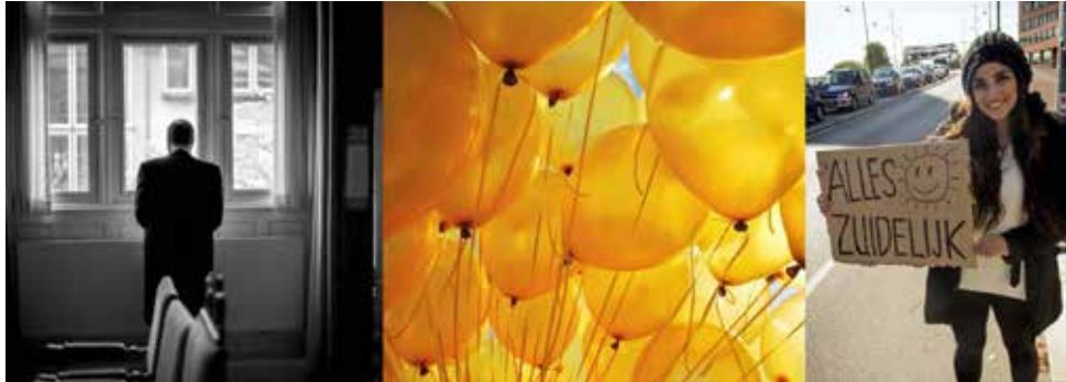
Album Amicorum, 2014 editie