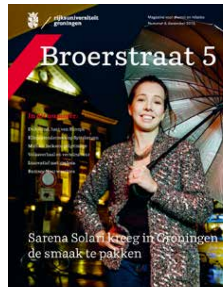
Alumnimagazine Broerstraat 5

Er werden dit jaar zeventien nieuwe internationale studenten getraind als ambassadeurs van de RUG. Deze 'International Alumni Ambassadors' helpen als vrijwilliger bij onder meer de rekrutering van aankomende studenten in het buitenland.