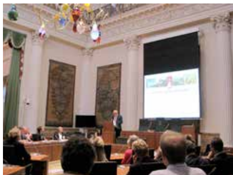
Bijeenkomst alumnikring Kennemerland