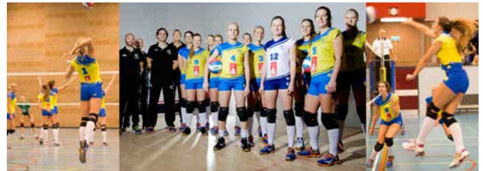
Studentenvolleybalteam Ubbo Emmius Fonds/Donitas Dames 1

Om de naamsbekendheid onder studenten te vergroten is het UEF in 2015 gaan samenwerken met studentenvolleybalteam Donitas Dames 1. Dit team speelde voor het eerst in twaalf jaar weer in de eredivisie. Het UEF faciliteerde de fondsenwerving die nodig is om de ambitie van de volleybalsters op topniveau te spelen, mogelijk te maken.