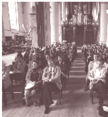
De opening van het academisch jaar voor alle internationale studenten in de Martinikerk