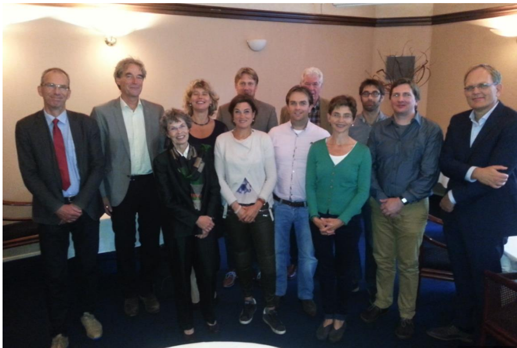
Bestuur GUF, Bestuur Gratama Stichting en sprekers