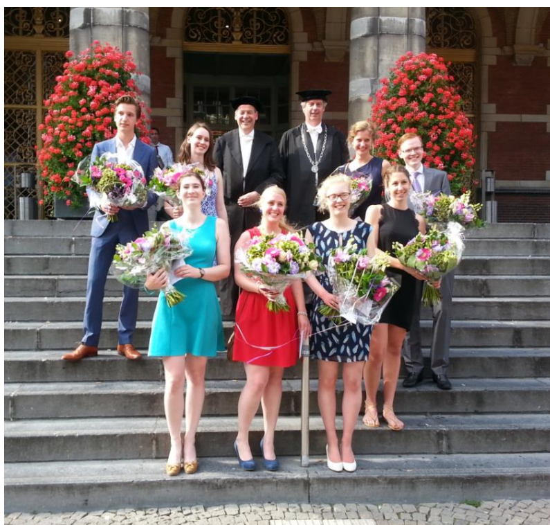
De winnaars van de GUF-100 prijzen

Tijdens de ‘Zomerceremonie’, de officiële afsluiting van het academisch jaar, op vrijdag 3 juli 2015 in de Aula van het Academiegebouw, reikte de voorzitter van het GUF-bestuur na een inleiding door de rector magnificus tijdens een plechtige ceremonie de prijzen uit aan de 9 winnaars.