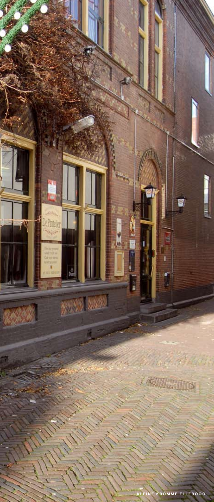
KLEINE KROMME ELLEBOOG