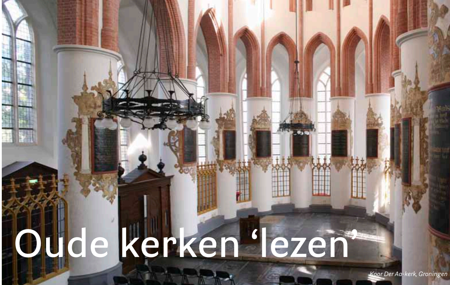
Koor Der Aa-kerk, Groningen