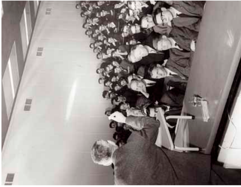
Professor Jan Pen geeft college in 1963

Groningse faculteit Econo- mie en Bedrijfskunde (FEB). Een deel van haar illustere alumni heeft de faculteit