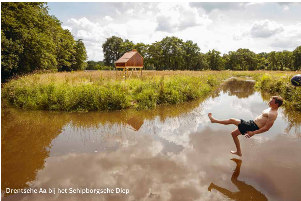
Drentsche Aa bij het Schipborgsche Diep

“Jazeker. Veel mensen zijn te fatalistisch, maar dan houdt alles op. En het is vaak ook gewoon niet wáár, wat ze zeggen. Er zijn de afgelopen jaren zóveel goede plannen gesmeed op het terrein van gebiedsgericht werken. Die plannen liggen bij elke provincie klaar, en van links tot rechts is iedereen daar enthousiast over. Als je goed met zijn allen nadenkt, en dan durft te kiezen voor die integrale benadering, dan kun je zóveel problemen oplossen. En het hoeft natuurlijk niet morgen af, hè. Het is prima als daar twintig, dertig jaar overheen gaat. Als je het maar samen aanpakt, en het niet van bovenaf oplegt. Als RUG leiden we de jonge deskundigen op die dat in de nabije toekomst gaan waarmaken.”