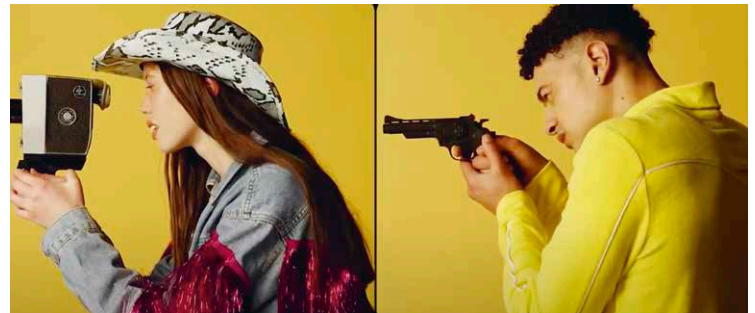
STILLS UIT YOUTUBE-FILM EN GEDICHT