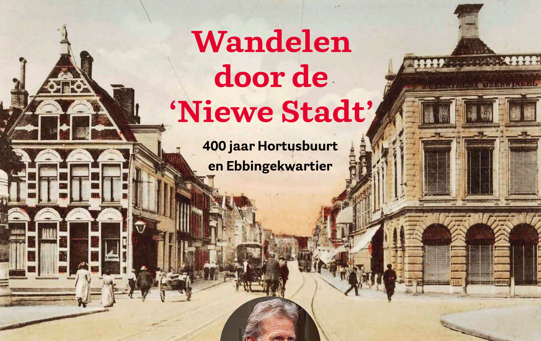
Nieuwe Ebbingestraat vanaf de brug