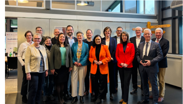
Besuch der Ems Dollart Region

Ihr Engagement trägt dazu bei, die Perspektiven der Bewohner*innen der Grenzregion besser in die nationale Politikgestaltung einzubeziehen.