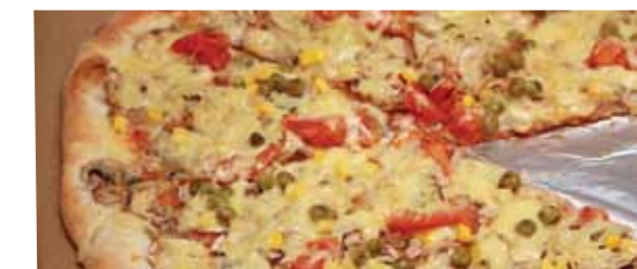
In een pizza zit soms genoeg zout voor een paar dagen

Meer lezen? Het Kennisdossier Gezondheid ( http://www.rug.nl/kennisdebat/onderwerpen/gezondheid ) biedt een uitgebreide variatie aan onderzoek en debat, van de biologische klok bij pubers tot kauwen tegen dementie.