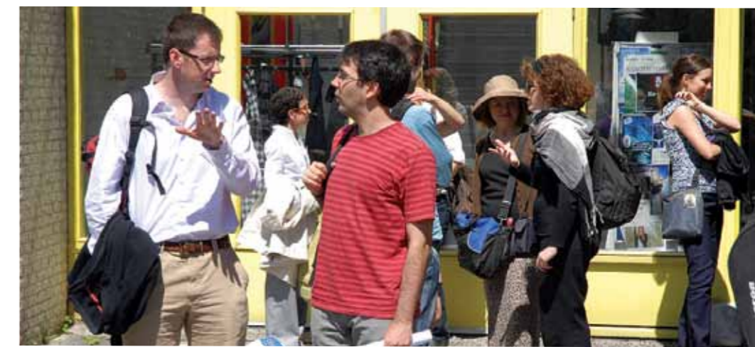
Tijd om uit te wisselen

Op een aantal terreinen zal met maatschappelijke organisaties binnen PERARES heel direct worden gewerkt aan het opstellen van een Europese onderzoeksagenda. Als pilot wordt in verschillende samenstellingen gewerkt aan drie thema's: nanotechnologie, Roma en andere reizende volken, en aanpak van huiselijk geweld. Op dit laatste thema werken een Engelse