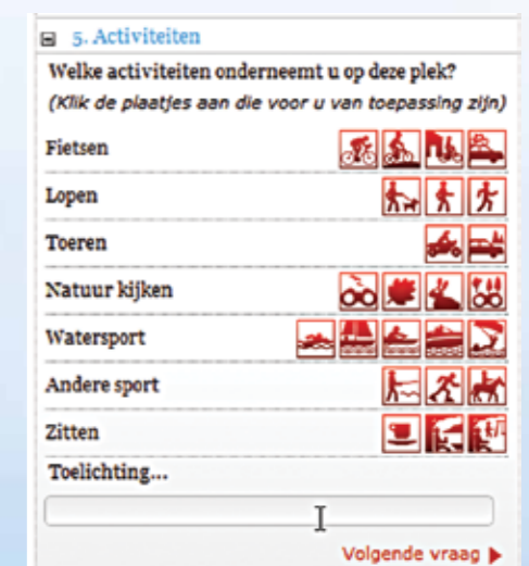
Een detailvraag van de hotspotmonitor.