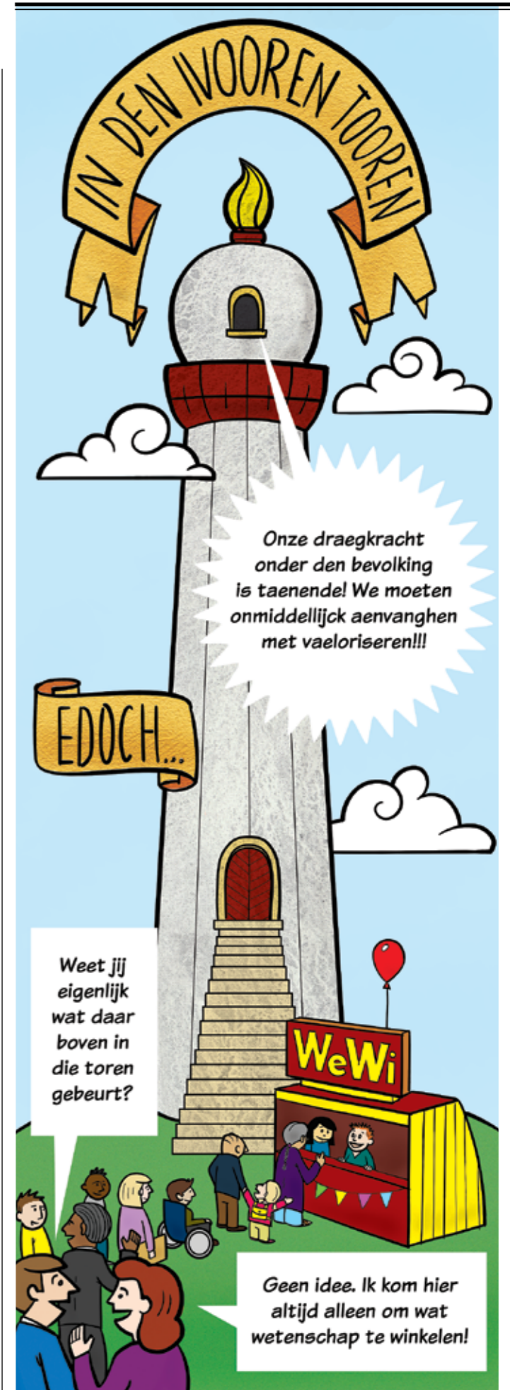
Illustratie: Paul de Vreede

Hoe zie je de toekomst voor de wetenschapswinkels? "Dat hangt natuurlijk ook sterk af van de maatschappelijke ontwikkelingen. Cultuur wordt momenteel door de politiek gezien als hobby, sommigen zeggen linkse hobby. De volgende stap is misschien gevaarlijke hobby. Dan is de kritische functie van de wetenschapswinkel mogelijk weer heel hard nodig, als een luis in de pels. Verder denk ik dat de wetenschapswinkel een rol kan spelen in het ontwikkelen van nieuwe visies op wetenschap. Uit ervaring weten ze wat de kansen en beperkingen zijn van maatschappelijk relevant onderzoek en kennisbenutting. En via de wetenschapswinkels kunnen andere onderzoeksgebieden en onderzoeksvragen op de agenda komen, daarop moet je alert blijven!"