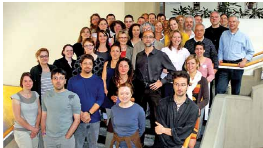
De hele PERARES-delegatie in Groningen