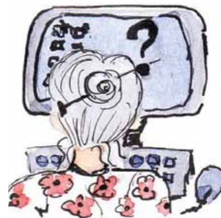
...die oudjes weten echt niets van computers...