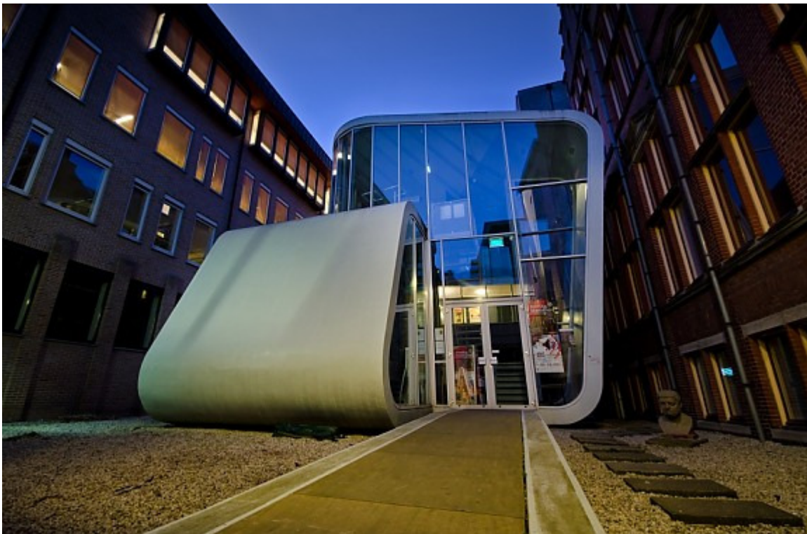
Expositie in het Universiteitsmuseum

Voor 2010 werd een project van Dr. H.Hansen gehonoreerd met € 25.000. Van zijn expositie 'Grenzeloos! Op zoek naar uitersten in de moderne fysica' staat een korte beschrijving vermeld op de GUF-webpagina.