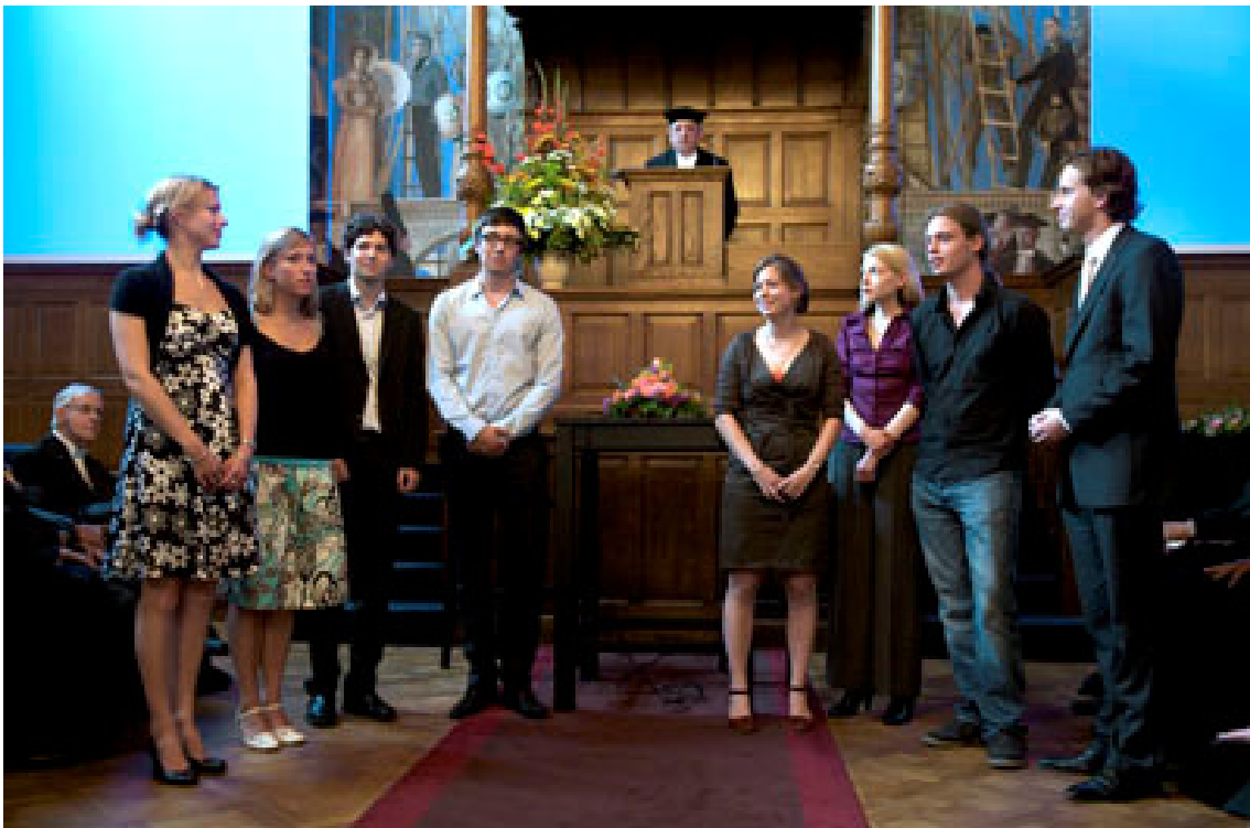
de winnaars (1 student ontbreekt)

Deze prijzen voor excellerende studenten werden voor het eerst uitgereikt ter gelegenheid van het 100-jarig bestaan van het GUF in 1993 en daarna om de vijf jaar, bij lustrumvieringen van de RUG.