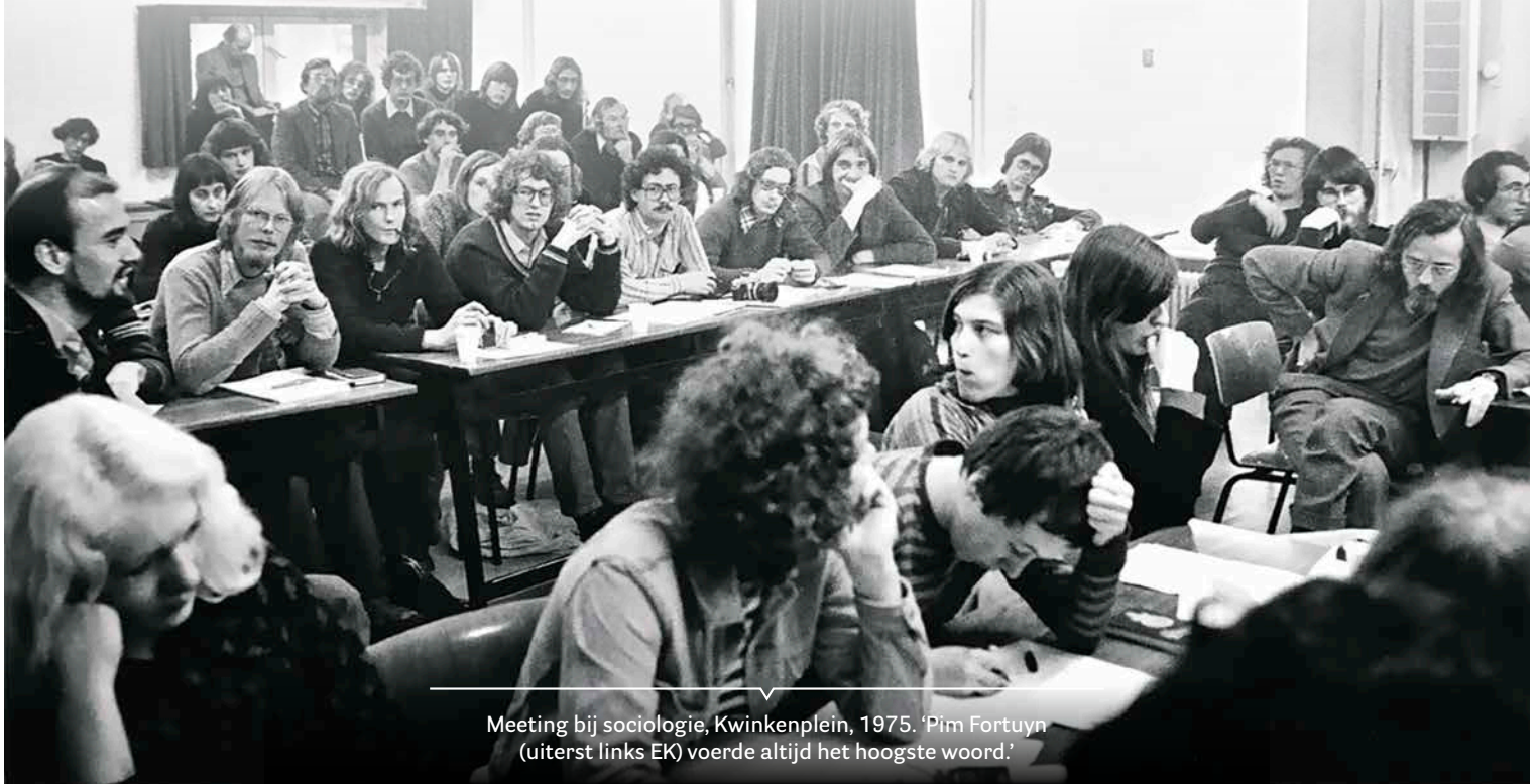
Meeting bij sociologie, Kwinkenplein, 1975. 'Pim Fortuyn (uiterst links EK) voerde altijd het hoogste woord.'

I n de jaren zeventig waren de studenten sociologie heel actief bij het onderwijs betrokken. Sociologie was booming en er gebeurde ontzettend veel op het instituut. Als student las je ook van alles buiten de verplichte boekenlijst om. Daar discussieerde je dan over. Tijdens de colleges was de interactie uiterst levendig. Je kon echt allerlei dingen inbrengen.