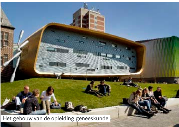
Het gebouw van de opleiding geneeskunde

G2010 is multidisciplinair. Dit betekent dat we vanuit verschillende disciplines naar een probleem kijken. Zo leer je in het eerste blok van jaar 1 aan de hand van klachten van het bewegingsapparaat (spieren, skelet, gewrichten en zenuwen) een aantal basisconcepten uit de celbiologie, histologie, anatomie en fysiologie. De zeven bekwaamheden kom je overal in G2010 tegen, in alle vakken, thema's, clusters, blokken, semesters en stages, zij het niet altijd tegelijk en ook niet altijd in even grote mate. Neem bijvoorbeeld het derde blok van het eerste jaar. Daarin wordt biomedische kennis van de ademhaling, hart en circulatie, nieren en spijsvertering geïntegreerd met de bekwaamheden handelen en behandelen. Deze bekwaamheden zie je terug tijdens de onderwijs-eenheden Basic Life Support (reanimatietraining) en EHBO. In de Engelstalige bacheloropleiding geneeskunde is er daarnaast veel aandacht voor het onderwerp 'global health'.