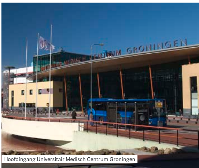
Hoofdingang Universitair Medisch Centrum Groningen

Als voorbereiding op een zorgstage in het eerste jaar doe je een training waarbij je als student op elkaar verzorgende handelingen uitvoert. Ook daarna oefen je nog regelmatig op je medestudenten in andere situaties. Want het is moeilijk om een patiënt, die in eerste instantie een vreemde is, op zijn gemak stellen, lichamelijk te onderzoeken en tegelijkertijd ook zelf nog eens ontspannen en aandachtig te zijn. Het omgaan en het praten met patiënten leer je door op en met elkaar te oefenen in rollenspellen en simulatietrainingen. Je vanaf het begin rustig en zeker voelen is belangrijk. Dat schept ruimte voor aandacht en zorgvuldigheid naar de patiënt en voor professioneel en authentiek gedrag bij jezelf.