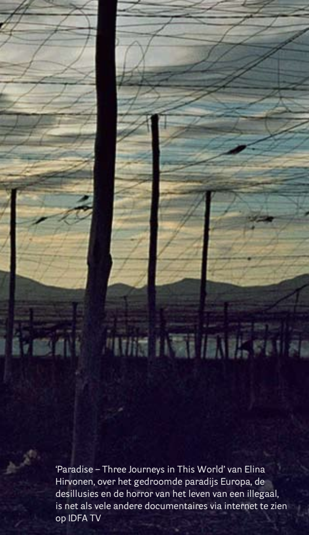
'Paradise – Three Journeys in This World' van Elina Hirvonen, over het gedroomde paradijs Europa, de desillusies en de horror van het leven van een illegaal, is net als vele andere documentaires via internet te zien op IDFA TV

titeld, het is gewoon te duur om dat allemaal in het Nederlands te laten doen. Jammer, want dat betekent toch dat je hele groepen uitsluit. Maar ik kan oprecht zeggen dat ik er alles aan gedaan heb om een zo groot mogelijk publiek te bereiken. We hebben programma's voor scholen, voor jonge filmmakers. En er komen jaarlijks 240 duizend bezoekers op ons festival af. Dat is toch heel veel?"